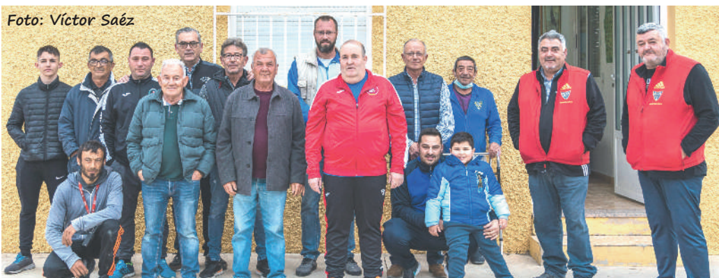
Club Ntra. Sra. del Rosario de La Algaida-Archena (Murcia)

La Algaida, pedanía de la población murciana de Archena, será este año la anfitriona del campeonato Copa Su Majestad el Rey, gesta que se llevará a cabo gracias a los esfuerzos de los miembros de este emblemático club que organizan por primera vez un nacional, aunque tienen experiencia por lo que a provinciales, regionales, intercomarcales y finales autonómicos se refiere.