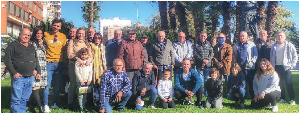
Club San José de Nules (Castellón)

En septiembre del año pasado los miembros de esta entidad colombicultora aceptaron albergar el campeonato nacional de Comunidades Autónomas en su edición 2022 tras la renuncia del municipio valenciano que en primer lugar había sido seleccionado.