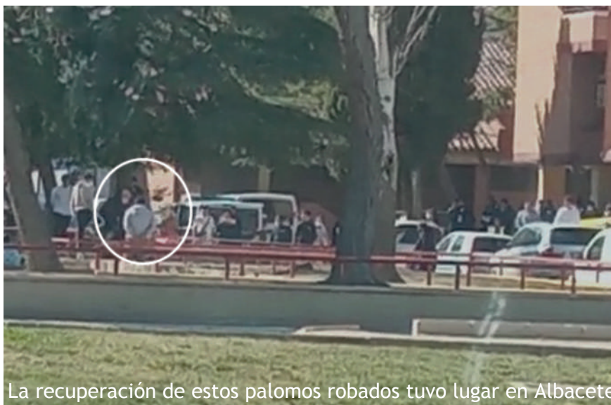
La recuperación de estos palomos robados tuvo lugar en Albacete

Días después de este hecho, la Realfec hizo público un listado con los datos de los palomos recuperados a fin de que los propietarios pudiesen recogerlos.