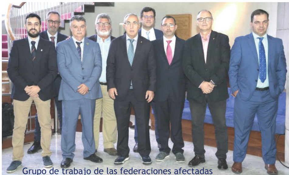
Grupo de trabajo de las federaciones afectadas

En palabras del presidente de la Real Federación Española de Colombicultura, Javier Prades, “ quienes han propuesto este anteproyecto no han tenido en cuenta que los deportes que se realizan con animales, como el nuestro, nos regimos por la legislación de ámbito deportivo, tanto a nivel nacional como europeo, por lo que consideramos que esta nueva normativa no es de aplicación en el ámbito de los palomos deportivos ”.